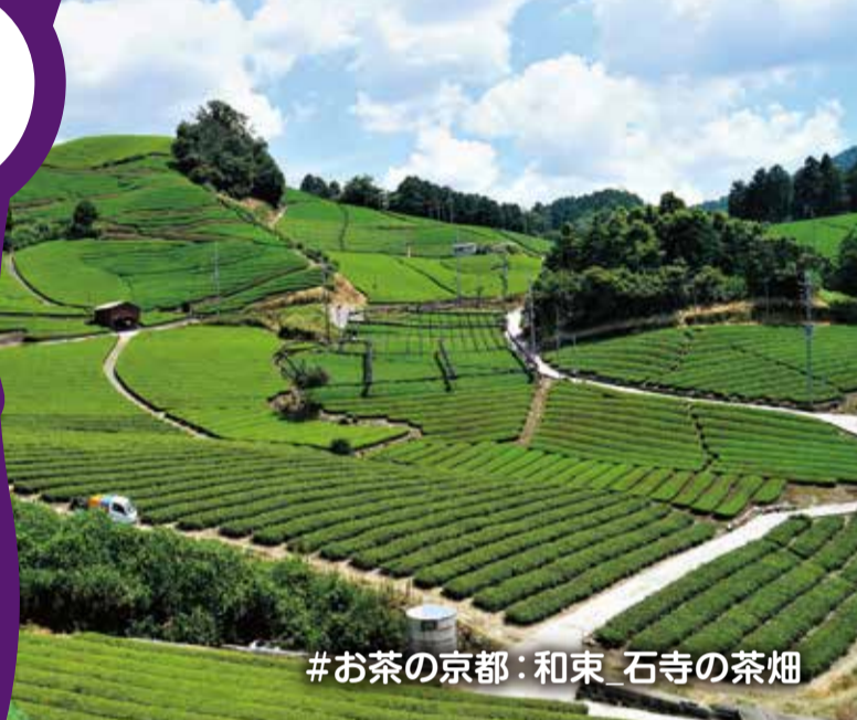
#お茶の京都: 和束 石寺の茶畑