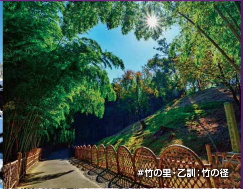
#竹の里・乙訓: 竹の径