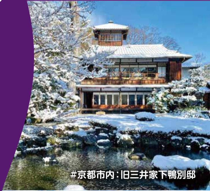
#京都市内: 旧三井家下鴨別邸