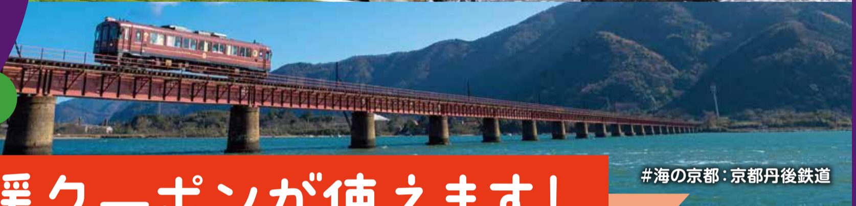
#海の京都: 京都丹後鉄道