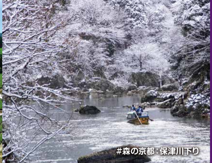
#森の京都: 保津川下り